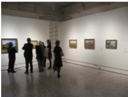
Utstilling i Villa Manin, Treviso 2010

Foruten egne utstillinger har Munch-museet vært hovedutlåner til utstillingene ”Munch und das Unheimliche” i Leopold Museet Wien, ”Munch og Åsgårdstrand” i Haugar Vestfold Kunstmuseum, og ”Munch og Warhol” på Lillehammer kunstmuseum. Til sammen trakk disse utstillingene nesten 185 000 besøkende. I tillegg har museet vært utlåner til ”Crime and Punishment” i Musée d’Orsay og ”Munch and The Spirit of The North. Scandinavian Art in the late 19 th Century” i Villa Manin Treviso, og det årlige utlånet til Idemitsu Museum of Arts i Tokyo.