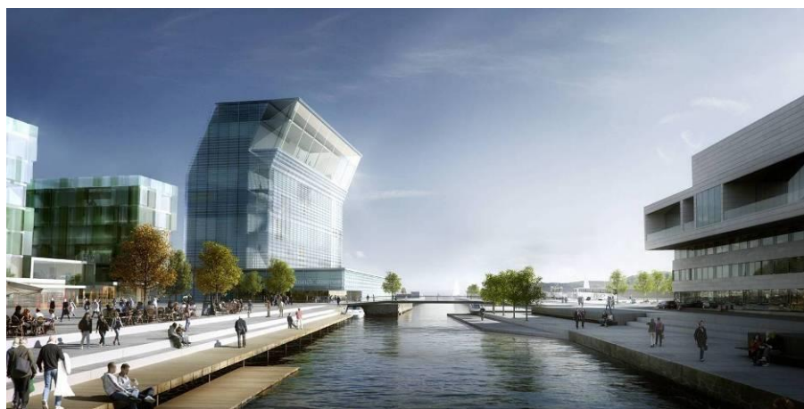
Nytt Munch-museum i Bjørvika

Gjennom hele 2010 har museets ansatte arbeidet sammen med Herreros Arquitectos og deres norske partner LPO, Byggherreetaten KIB (Kulturbyggene i Bjørvika), Advansia med ansvar for prosjektering, samt rådgivende ingeniører. Fokus fra museets side er å sørge for størst mulig måloppnåelse basert på byrådets bestilling slik den er artikulert i konkurranseprogrammet, og brukernes rom og funksjonsprogram.