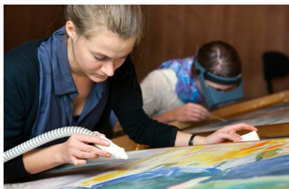
Konservering av malerier har vært i fokus i 2010