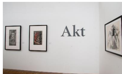
Populære utstillinger i 2010