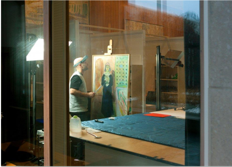
Midlertidige arbeidsplasser for konservering er etablert i museets foredragssal

Bystyret bevilget 2 mill. kr. i juni 2010 for å forsere arbeidet med konservering i forbindelse med flytting til Bjørvika.