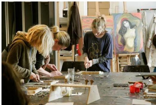
Verksted for barn og unge