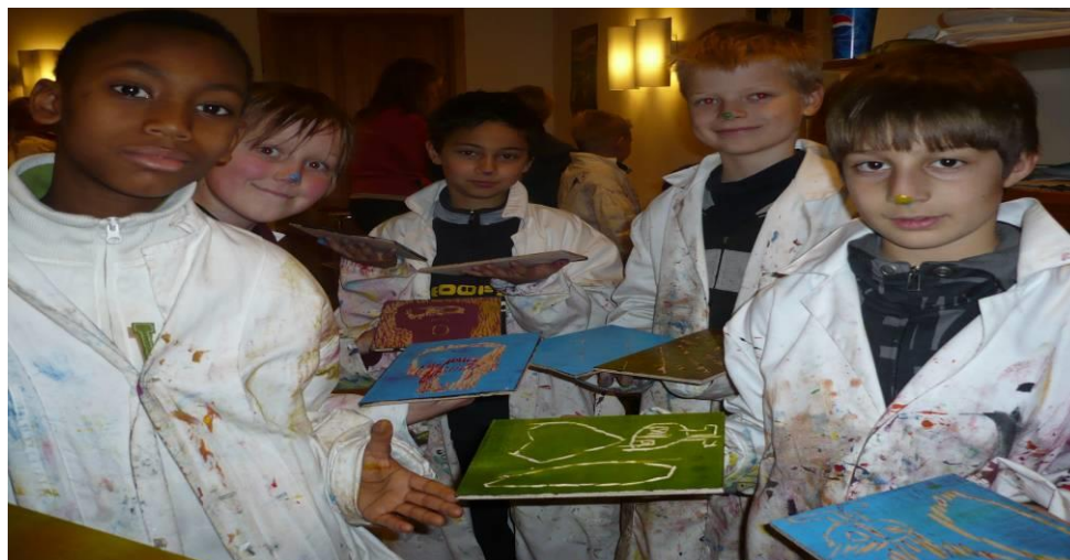
Det har vært betydelig aktivitet blant barn og unge